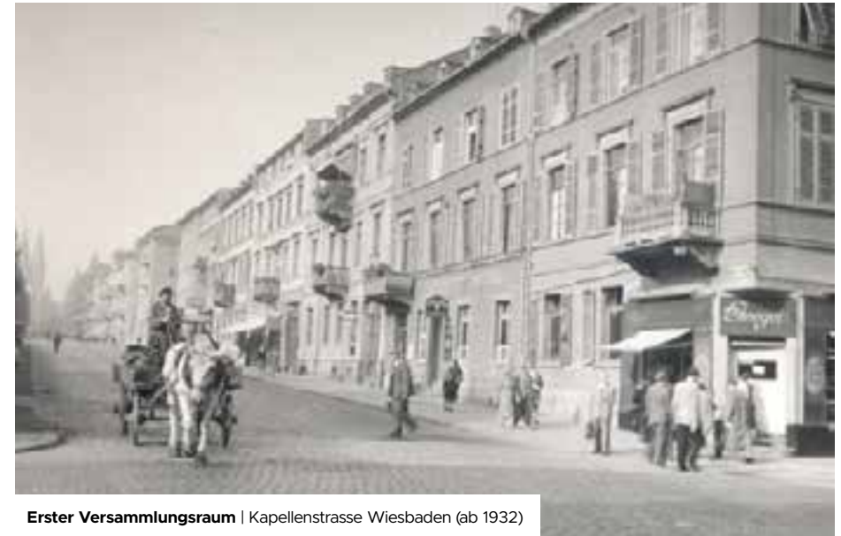
Erster Versammlungsraum | Kapellenstrasse Wiesbaden (ab 1932)

Der Herzschlag entwickelte sich immer mehr in die Richtung, Kirche für und in die Stadt zu sein und die Liebe Gottes weiterzugeben. Dies durften wir ganz praktisch seit September 2021 mit zahlreichen Aktionen, unseren "Overflow GO-Aktionen", umsetzen. Dabei konnten wir die Menschen unserer Stadt auf verschiedene Art und Weise beschenken und ihnen Zuwendung entgegenbringen.