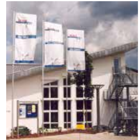
Gemeindezentrum in Dotzheim Willi-Juppe-Strasse Wiesbaden (ab 2001)