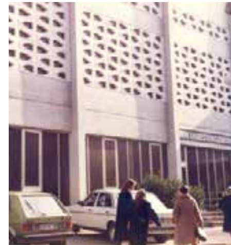
Eigenes Gemeindegebäude Emserstrasse Wiesbaden (ab 1973)